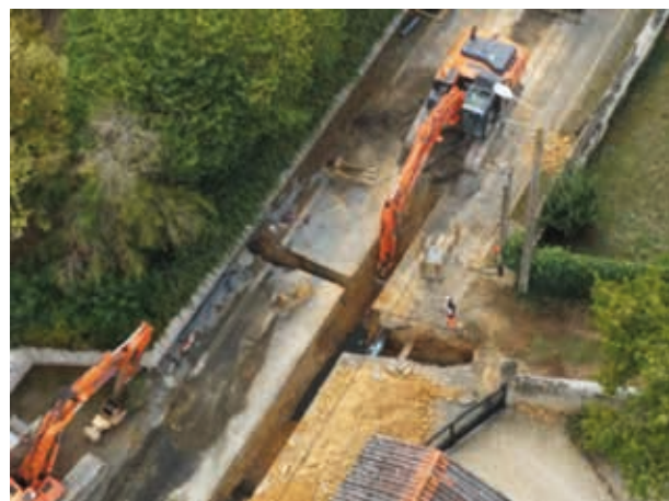
Irais : vue aérienne des travaux d'assainissement.

Les informations pratiques seront accessibles sur le site de la Communauté de Communes dès la fin de l'année.